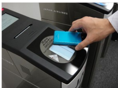
（読み取り機にタッチして登録情報を確認）

会員情報への登録により、 障害者割引の航空券をインターネットで購入した場合でも、チェックイン時に障害者手帳を提示する必要はなく、直接保安検査場へ行くことも可能。